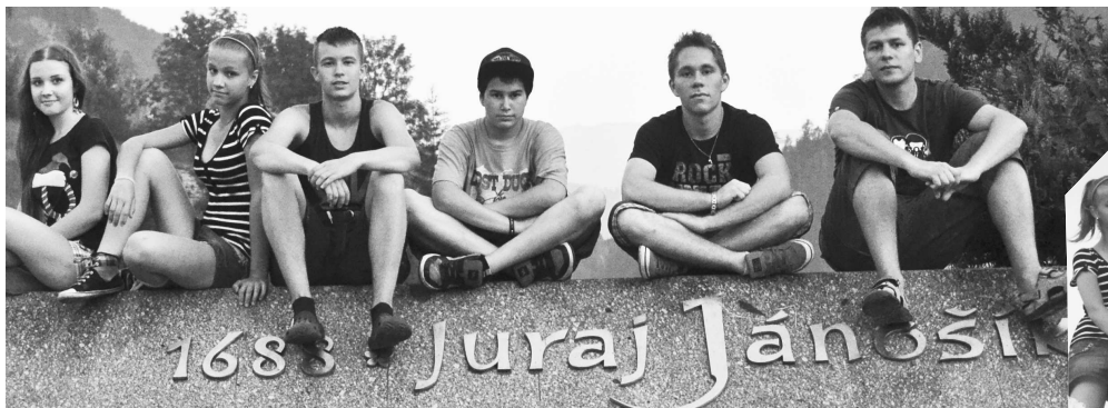
Zvečnili sme sa aj pri pamätníku a soche Jánošíka