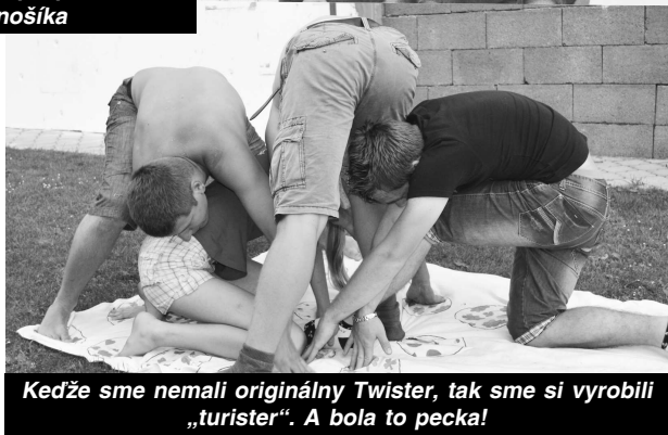
Keďže sme nemali originálny Twister, tak sme si vyrobili „turister“. A bola to pecka!