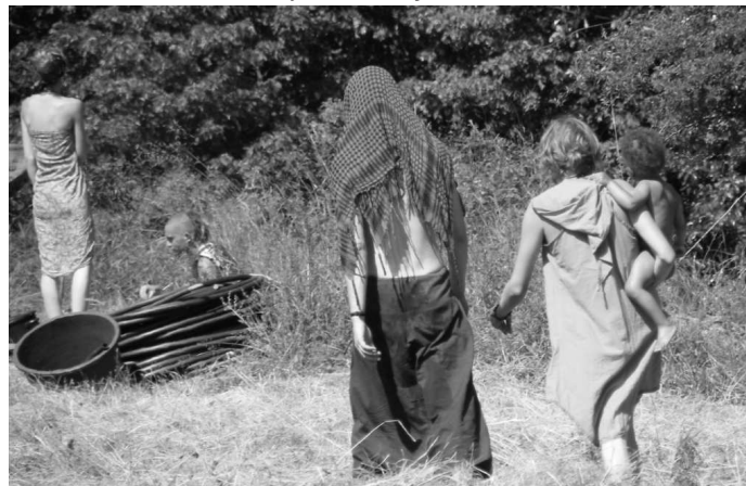
Pred objektívom fotoaparátu sa členom Dúhovej rodiny nechcelo pózovať