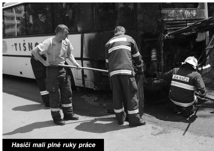
Hasiči mali plné ruky práce