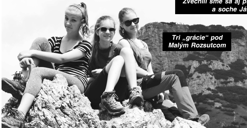
Tri „grácie“ pod Malým Rozsutcom