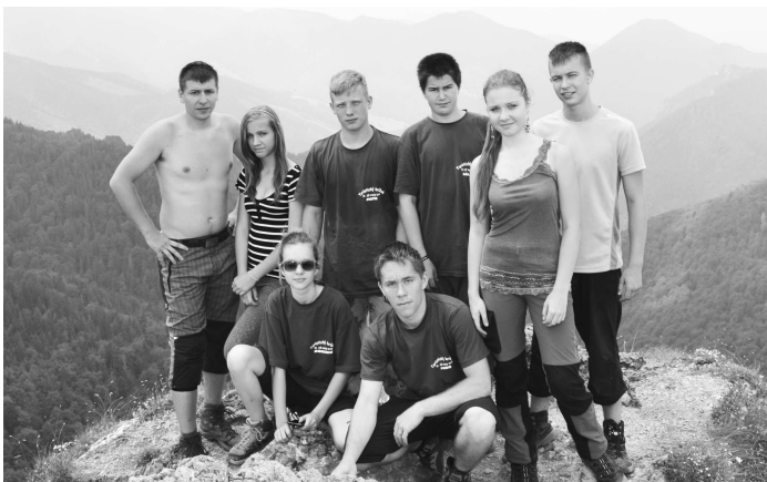
Na vrchole malého Rozsutca (1343,5 m.n.m.). Vyššie sme ešte nikdy neboli

Na záver školského roku sa členovia nášho turistického krúžku rozhodli, že opustia svoje najbližšie okolie a dobyjú niekoľko vrcholov v Malej Fatre. A tak osem z nás vycestovalo od 21.6. do 24.6. 2013 na sever Slovenska.