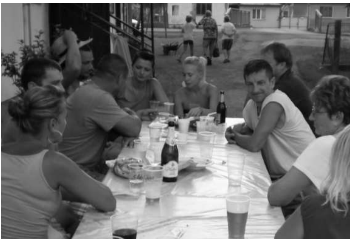
Oddych pri príjemnom posedení