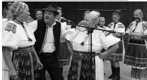
Do vtipného dialógu žien sa rád zamiešal aj muž - (tak ako to chodí aj v živote). Prizerali sa im, ale najmä tancovali a spievali členovia DFS Hrachovinka zo Senohradu