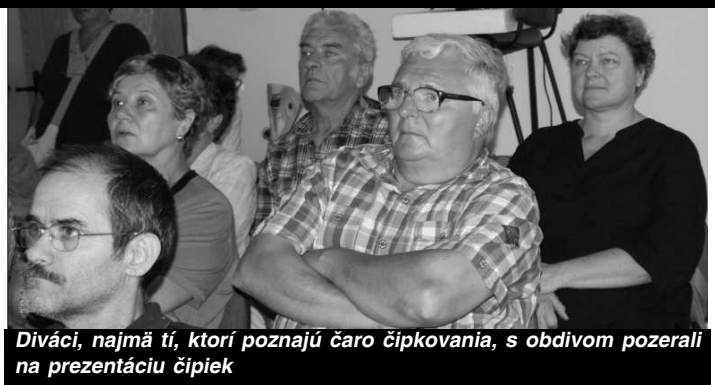
Diváci, najmä tí, ktorí poznajú čaro čipkovania, s obdivom pozerali na prezentáciu čipiek