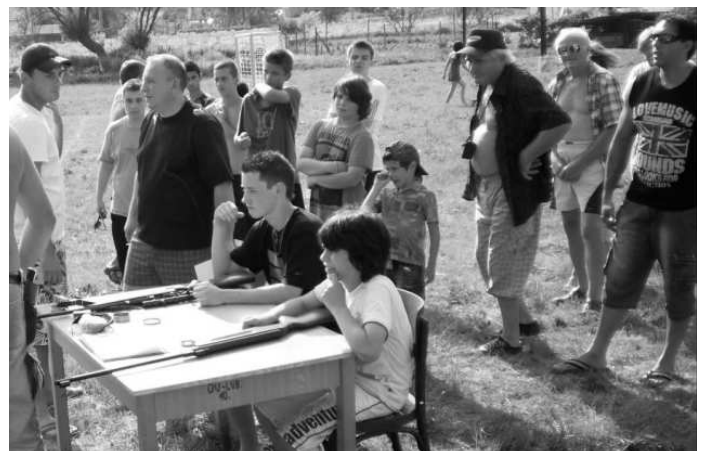
Veľký záujem bol o streleckú súťaž