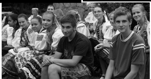
Diváci i účinkujúci sa tešili na program na amfiteátri, hoci chýbalo málo a počasie by im ho nebolo prialo