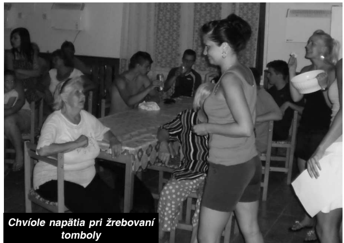
Chvíle napätia pri žrebovaní tomboly