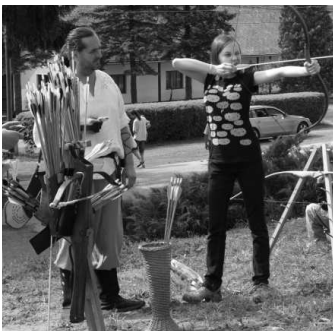
Lukostrelec z neďalekej Litavy doprial aj divákovi vyskúšať si svoju kušu a šípy