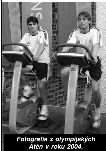
Fotografia z olympijských Atén v roku 2004.

END-USER FIRST! If Technogym grows, you grow too!