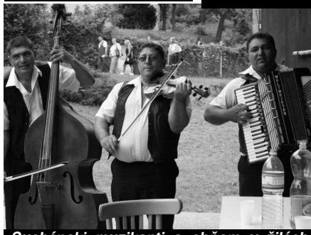
Sucháňskí muzikanti s ohňom v žilách svojimi temperamentnými piesňami na chvíľu rozohnali aj mraky, aby vytvorili divákovi pohodu