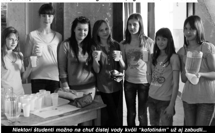
Niektorí študenti možno na chuť čistej vody kvôli „kofotínám“ už aj zabudli...

rým pocitom mohli pokračovať v štúdiu. Ale to nebolo všetko. Kto sa v tento deň obliekol kompletne do modrého, získal výhru, ktorá je pre študenta jedna z tých v á c n e j š í c h . Jeden deň bez skúšania. Týchto „modrých“ ľudí sme počas veľkej