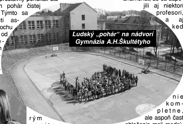
Ľudský „pohár“ na nádvori Gymnázia A.H.Škultétyho

znamenat', že sa zapojili aj niektorí profesori, ktorí sa aj keď